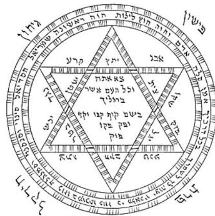
Gwiazda Dawida (Magen David)