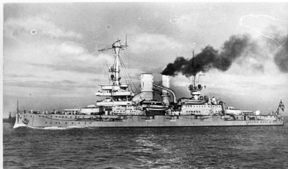
DVM 10 Bild-23-63-47 1 1926/1935 ca.