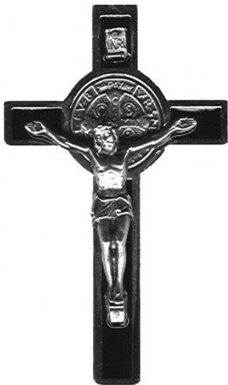
Według Kościoła Katolickiego krzyż ten, zawierający medalik ze Św. Benedyktem, chroni przed złymi mocami.

Ostatnie miesiące przyniosły nam doniesienia mediów o poniżającym traktowaniu katolików, słynie z tego „Gazeta Wyborcza”, której redaktorzy w sposób tendencyjny przedstawiają obraz katolika.